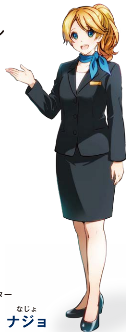
させぼ競輪 公式キャラクター くじゅうくしま なじよ 九十九島 ナジヨ