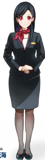
させぼ競輪 公式キャラクター くじゅうくしま なみ 九十九島 凧海