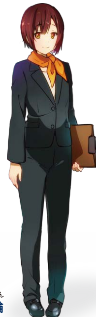
させぼ競輪 公式キャラクター くじゅうくしま りん 九十九島 輪